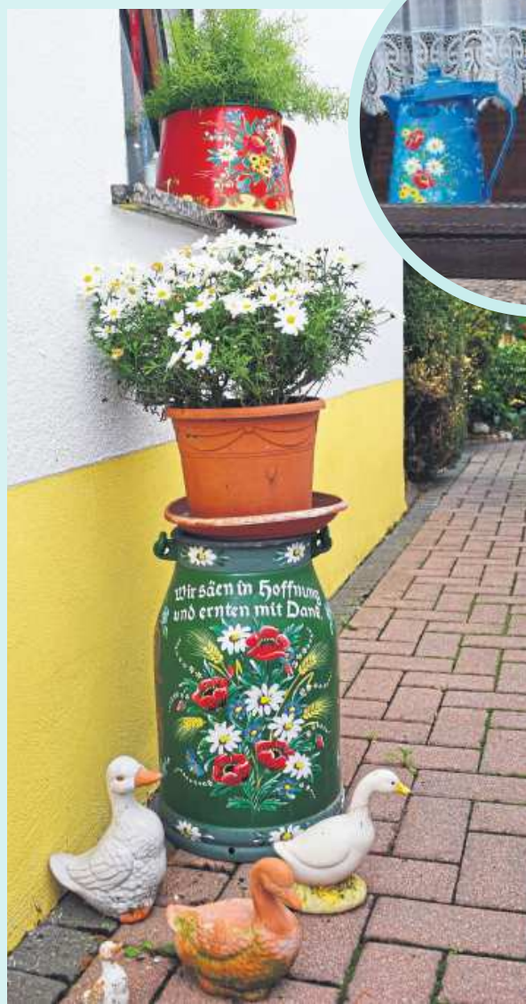
Von der Milchkanne über die Truhe bis hin zum Milchkrug – das Repertoire der bäuerlichen Malerei ist vielfältig und gehört ein Stück weit auch zu den Traditionen auf dem Lande. Und jedes Exemplar ist ein Unikat.